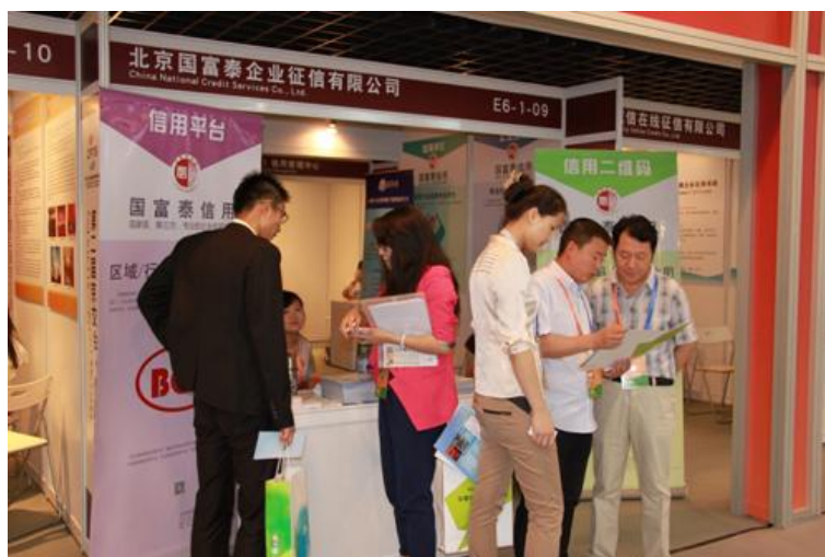
京交会国富泰展位现场

6月1日，为期5天的第二届中国（北京）国际服务贸易交易会(简称京交会 CIFTIS)，落下帷幕，本次京交会首次将信用列入展览展示的专业板块，重点举行了信用信息征信体系建设、信用服务业机构体系建设，信用服务的应用与发展等方面的探讨，国富泰公司作为信用行业的“国家队”得到组委会的热情邀请，参与了本次京交会的展览展示，“京交会·信用服务贸易推介会”的专题会议。