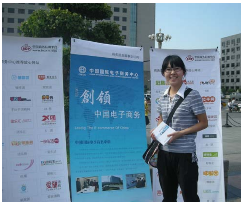
（中国国际电子商务中心·BCP信用认证中心携“认证网站”参展）

9月4日上午，河北省整规办连同省商务厅、省卫生厅、省物价局、省卫生厅、省国税局、省地税局、省消费者协会等28个省市部门以及12家商业单位在石家庄市人民广场开展了“诚信兴商宣传月”活动。